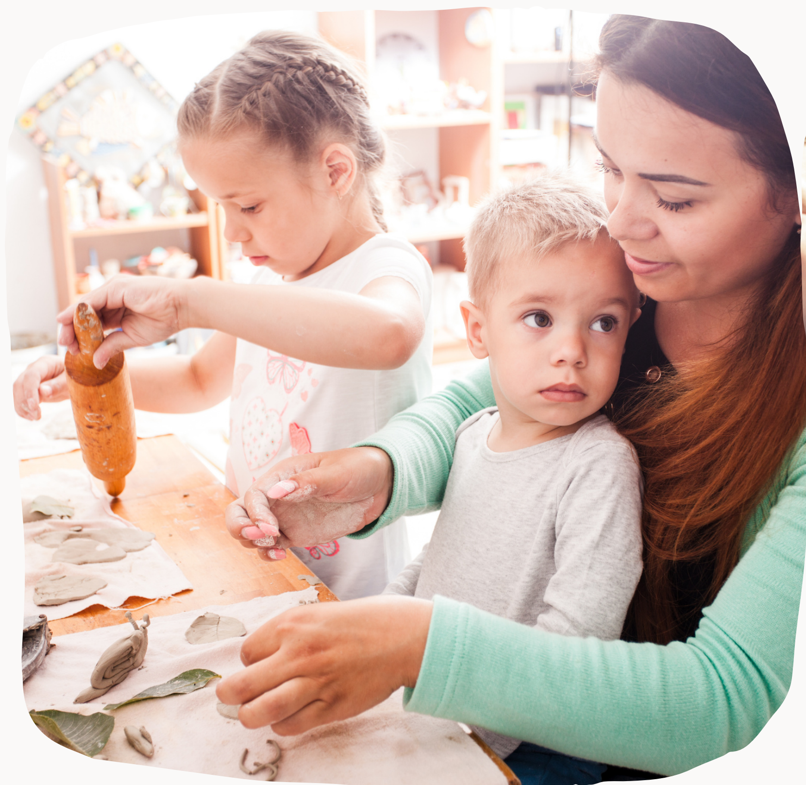
Schéma Départemental des Services aux Familles